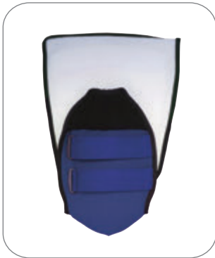
1. C&S Splint를 개봉합니다.