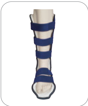
4. 벨크로를 채워 고정시킵니다.