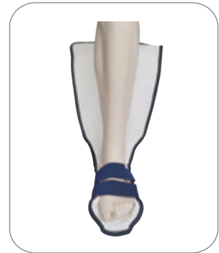
3. 벨크로를 고리에 걸어서 채웁니다. (체형에 맞게 성형 가능)