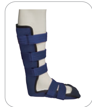
6. 완성된 Splint입니다.