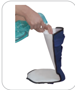
2. 양쪽 끝을 벌려 물을 뿌립니다.